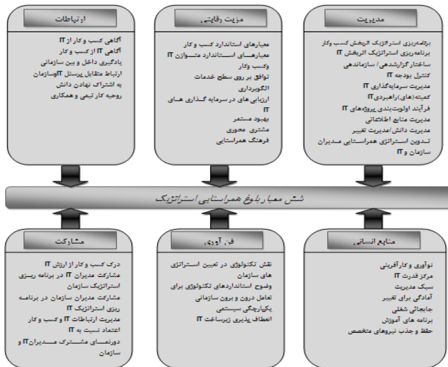
نمودار ۲- شاخص های مدل سنجش بلوغ همراستایی استراتژیک لوفتمن (لوفتمن، ۲۰۰۰)

۲-۳-۲- مدل بلوغ معماری سازمانی State of Oregon این مدل که دارای ۸ بعد می باشد و در سال ۲۰۰۷ بر اساس شاخص های مدل مطرح گارتنر ارائه