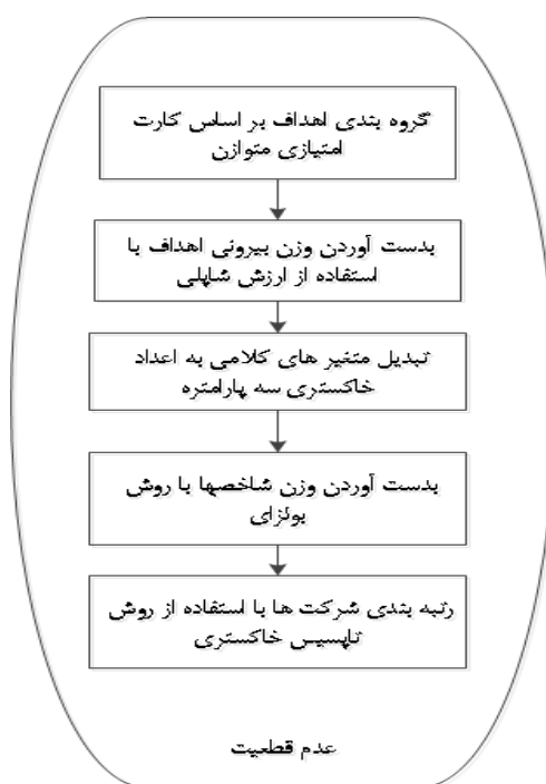
شکل ۲: مدل پیشنهادی