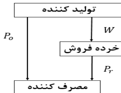
شکل ۱- رقابت در زنجیره تأمین

در کانال غیرمستقیم، فروش به صورت سنتی و از طریق خرده‌فروش انجام می‌شود؛ به این صورت که تولیدکننده محصولات را با قیمت واحد w به خرده‌فروش واگذار می‌کند و خرده‌فروش همان محصول را با قیمت P_r به مصرف‌کننده می‌فروشد و هیچ‌گونه خدمات دیگری ارائه نمی‌دهد. دیگر کانال فروش به صورت آنلاین است؛ یعنی مصرف‌کننده کالای مدنظر خود را از طریق سایت و با قیمت P_o از تولیدکننده خریداری می‌کند. به دلیل وجود دو کانال برای فروش محصولات، رقابت بین دو کانال برای دستیابی به سهم بیشتری از بازار وجود دارد. عامل مهمی که در این رقابت تأثیرگذار است و در این مقاله بررسی می‌شود، قیمت فروش محصولات در دو کانال است. این رقابت به صورت شماتیک در شکل (۱) نمایش داده شده است. مطابق با کومار و روان (۲۰۰۶) مصرف‌کنندگان به دو دسته تقسیم شده‌اند که عبارتند از مصرف‌کنندگان وفادار به خرده‌فروش و وفادار به تولیدکننده. برای مصرف‌کنندگان وفادار به خرده‌فروش تولیدکننده مهم نیست؛ یعنی آنها محصول را از فروشگاه مدنظر خود تهیه می‌کنند و برند برای آنها اهمیت ندارد؛ اما مصرف‌کنندگان وفادار به تولیدکننده فقط در پی برند تولیدکننده مدنظر خود هستند. درصد مصرف‌کنندگانی که وفادار به خرده‌فروش هستند با نرخ k تعیین می‌شوند و سایر مصرف‌کنندگان به تولیدکننده وفادارند. تولیدکننده برای تأمین کردن تقاضای دو کانال از دو گزینه استفاده می‌کند. قسمتی از تقاضا از طریق تولید داخلی تولیدکننده تأمین می‌شود. ظرفیت تولید داخلی به صورت قطعی و از پیش تعیین شده است و با Y نشان داده می‌شود.