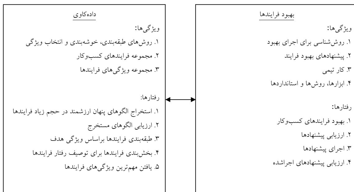
شکل ۱- چارچوب نظری ارتباط بین کارکردهای داده‌کاوی و بهبود فرایندها

شکل ۱ چارچوب نظری مستخرج از پیشینه پژوهش را نشان می‌دهد. این چارچوب ارتباط بین کارکردهای داده‌کاوی و بهبود فرایندها را ارائه می‌کند. کارکردها، دارای تعدادی ویژگی و رفتارند. ویژگی‌ها نشان‌دهنده مشخصه‌های کارکردها هستند. رفتارها مجموعه اعمالی است که هر یک از کارکردها در مواجهه با یکدیگر انجام می‌دهند. نوآوری این مقاله، ارائه چارچوبی برای به‌کارگیری داده‌کاوی برای بهبود فرایندها است. در این چارچوب از داده‌کاوی برای شناسایی الگوهای پنهان در حجم زیاد فرایندها استفاده می‌شود؛ با استفاده از این الگوها، پیشنهادهای بهبود برای فرایندها ارائه می‌شود.